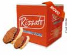
BISC. ROMEU E JULIETA 2KG