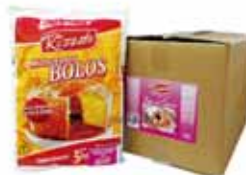
MISTURA BOLO CHURROS 5KG