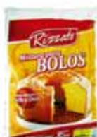
MISTURA P/ BOLOS 5KG