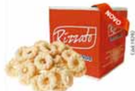
BISC. ROSCA DE LEITE 2KG