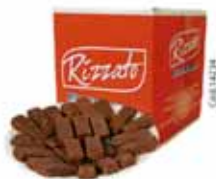
BISC. MINI WAFER 2KG