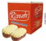
BISC. AMOR PERFEITO 2KG