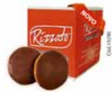
BISC. PÃO DE MEL 2KG