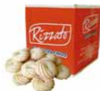
BISC. ROSCA DE COCO 2KG