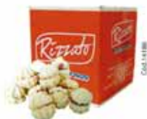
BISC. FLORZINHA 2KG