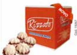
BISC. CASADINHO C/ GOIABA 2KG