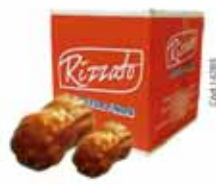
BISC. PRESTÍGIO 2KG