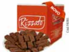
BISC. MINI WAFER COM COBERTURA 2KG