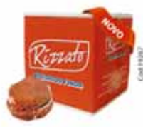
BISC. CASADINHO DE CHOC. C/ GOIABA 2KG