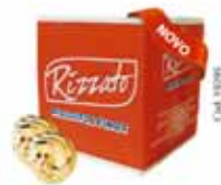
BISC. ROSCA DE NATA GRANULADO 2KG