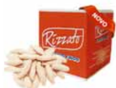
BISC. CHAMPANHOTA 2KG