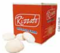
BISC. PÃO DE MEL BRANCO 2KG