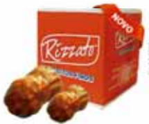
BISC. PRESTÍGIO 2KG