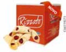
BISC. GRAVATINHA (BELISCÃO) 2KG