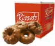
BISC. OURO PRETO 2KG