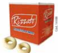
BISC. BAMBOLÉ 2KG