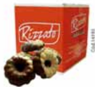
BISC. OURO BRANCO 2KG