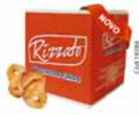
BISC. MILHO VERDE 2KG