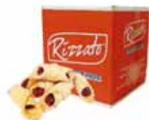
BISC. GRAVATA (BELISCÃO) 2KG