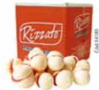
BISC. BEIJINHO DE FREIRA 2KG