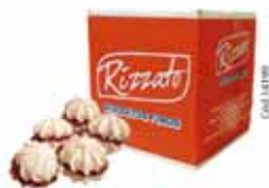
BISC. CASADINHO C/ GOIABA 2KG