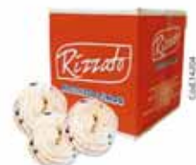
BISC. ROSCA DE FLOCOS 2KG