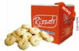
BISC. ROSCA DE NATA 2KG