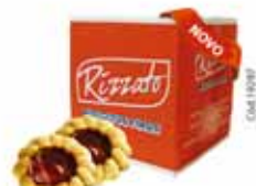
BISC. TORTA RECHEADA MORANGO 2KG