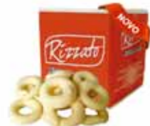
BISC. BAMBOLÊ 2KG