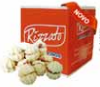
BISC. FLOZINHA 2KG