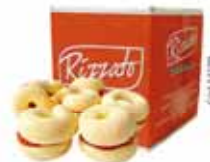
BISC. BAMBOLÉ RECHEADO C/GOIABA 2KG