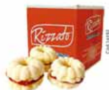
BISC. UGA UGA 2KG