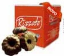
BISC. OURO BRANCO 2KG