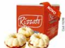
BISC. UGA UGA 2KG