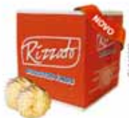
BISC. ROSCA NATA C/ COCO 2KG