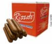
BISC. PALITO DE CHOCOLATE 2KG