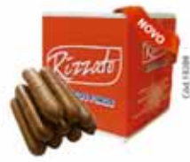
BISC. PALITO C/ COBERTURA DE CHOC. 2KG