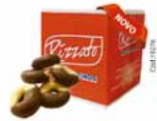
BISC. JUJU 2KG