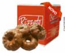
BISC. OURO PRETO 2KG