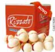
BISC. BEIJINHO 2KG