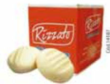
BISC. LEITE CONDENSADO 2KG