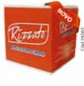
BISC. AMANTEIGADO LEITE 2KG