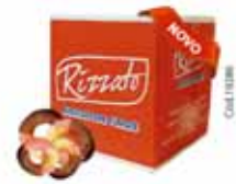
BISC. NAPOLITANO 2KG