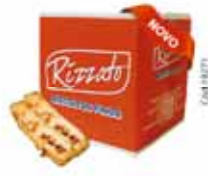
BISC. GLAMOUR 2KG