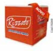
BISC. COOKIE CASTANHA COM LINHAÇA 2KG