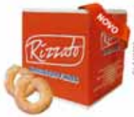
BISC. LEITE CONDENSADO 2KG